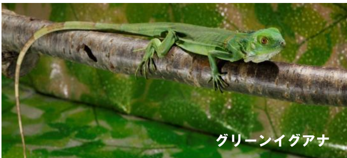
グリーンイグアナ

世界中に生息する爬虫類を展示し、その生態や体の特徴、人との関わり等を紹介しします。