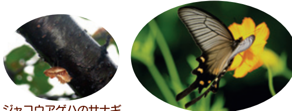
ジャコウアゲハのサナギ