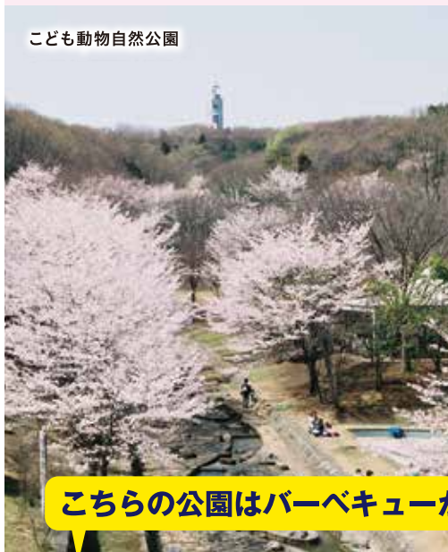
こども動物自然公園