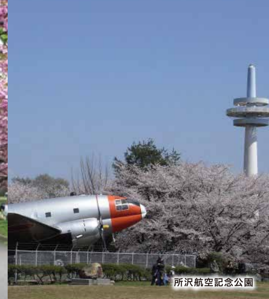
所沢航空記念公園