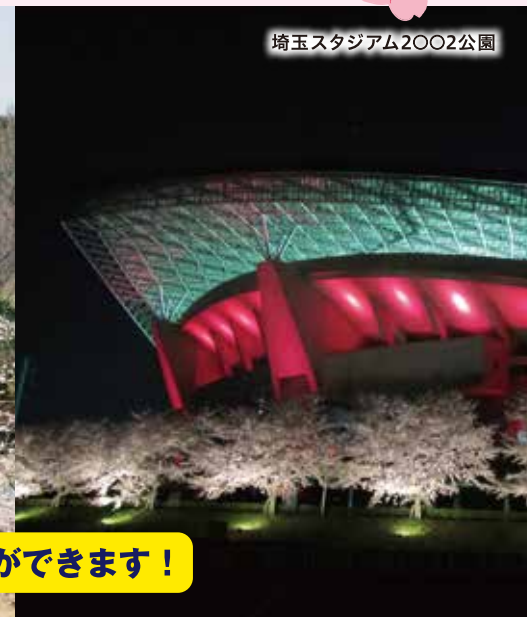
埼玉スタジアム2002公園