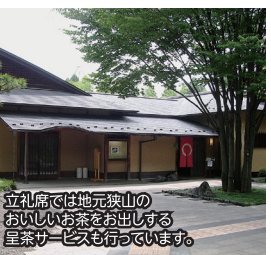
立礼席では地元狭山の美味しいお茶をお出しする皇茶サービスも行っていきます。

利用時間 9:00~20:00 利用人数 お部屋によって異なります ※詳細はお問い合わせください。 主な用途 お茶会、句会など